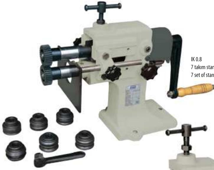
IK 0.8 7 takım standart vals topu ve top açma anahtarı ile beraber 7 set of standard rolls and roll key